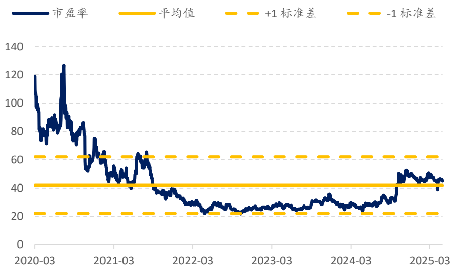
图表 5：华润微当前远期市盈率 44.8x，历史均值 41.9x