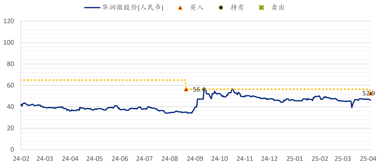
图表 6: SPDBI 目标价: 华润微